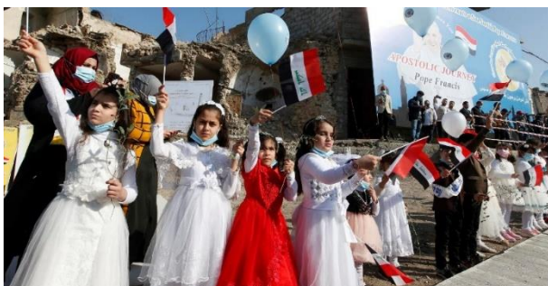
Iraakse meisjes juichen de paus toe in Mosul.

Het straatbeeld is totaal verwoest: opengereten gebouwen, bergen van puin, kapotte wegen, en gebedshuizen die nog steeds de sporen dragen van een oneigenlijk gebruik als gevangenis of rechtbank. Toch heerst er deze ochtend een feestelijke stemming. "Alalà, alalà", schreeuwen vrouwen als teken van gejubel. De menigte – bestaande uit christenen, maar ook veel moslims – staat als sinds de vroege uren van de ochtend langs de weg, veel eerder dan de aankomst van de paus op het internationale vliegveld van Erbil.