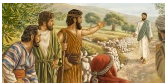
Navertelling Johannes 1,35-42